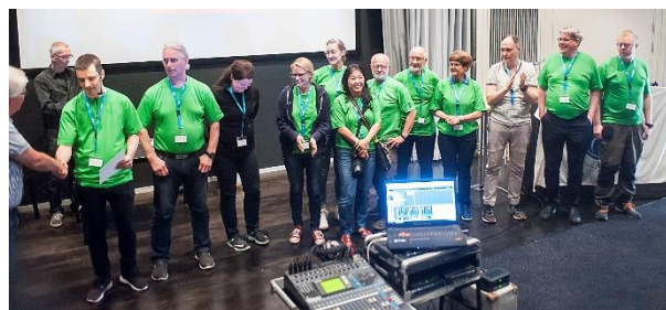
Gänget som gjorde 't

Vi tackar Sundsvalls FK för ett väl genomfört och trevligt program i denna vackra stad i strålande väder.