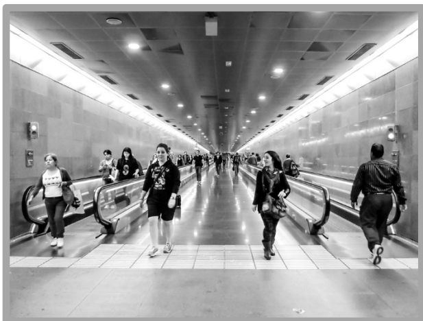
© Fridolin Hellmig Årets ungdomsfotograf 2015

Den fotograf som varit mest framgångsrik i årets Riksfotoutställning respektive Ungdomsgruppen utses till Årets Fotograf och Årets Ungdomsfotograf.