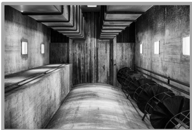
© Per Andersson Årets fotograf 2015